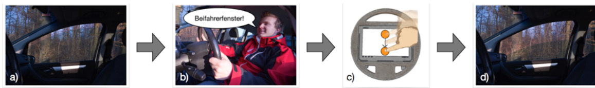
Abbildung 1: Vereinfachter Ablauf für multimodale Interaktion: Das Lenkrad als zentrales Bedienelement wird interaktiv und erlaubt dem Benutzer, Funktionen über Sprache und Zeigegesten multimodal zu bedienen, wie hier am Beispiel des Fensteröffnens demonstriert: (a) Zum Öffnen des Fensters (b) wählt der Fahrer dieses zuerst per Sprache aus, (c) um dann über eine Zeigegeste auf dem Multitouch-Lenkrad (d) das Fenster weiter zu öffnen.

Daher haben wir einen Ansatz entwickelt, der Touch- und Spracheingaben kombiniert und die zuvor genannten Probleme der einzelnen Modalitäten umgeht [7]. Nutzern fällt es relativ einfach, (sichtbare) Objekte in der Umgebung (z.B. Fenster) zu benennen, deshalb wird Spracheingabe zur Objektwahl benutzt (z.B. „Fahrerfenster“). Weil die Manipulation der Objekte per Sprache sehr komplex ist, benutzt der Fahrer im Anschluss stattdessen einfache Zeigegesten (z.B. Fingerbewegung von oben nach unten) zur Manipulation (vgl. Fehler! Verweisquelle konnte nicht gefunden werden. ). Die Gesten werden auf einem berührungsempfindlichen Lenkrad ausgeführt. Dieses steht dem Fahrer komplett als Interaktionsfläche zur Verfügung. So kann der Fahrer, ohne auf die Interaktionsfläche zu achten, Gesten ausführen und die Augen auf der Straße behalten.