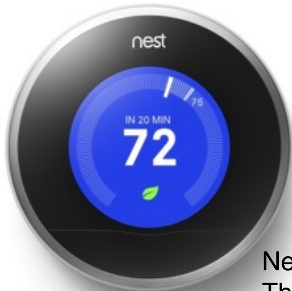
Nest Learning Thermostat